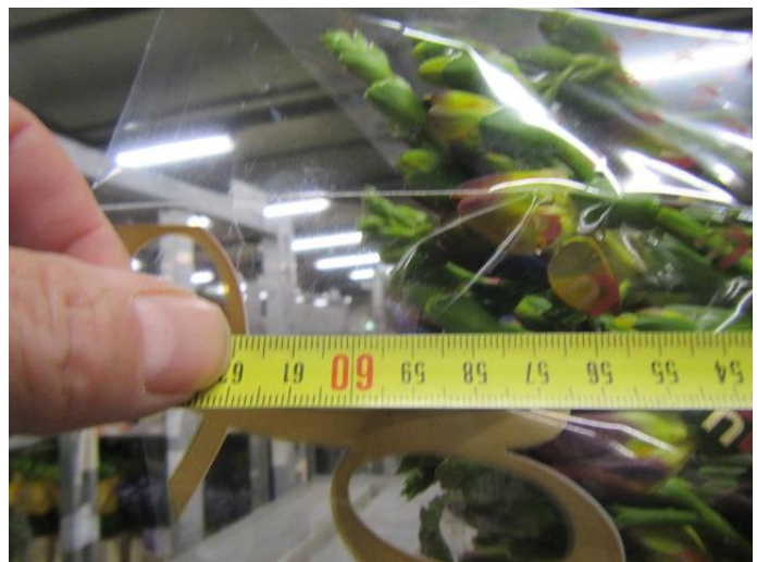
Onderkanten netjes gelijk