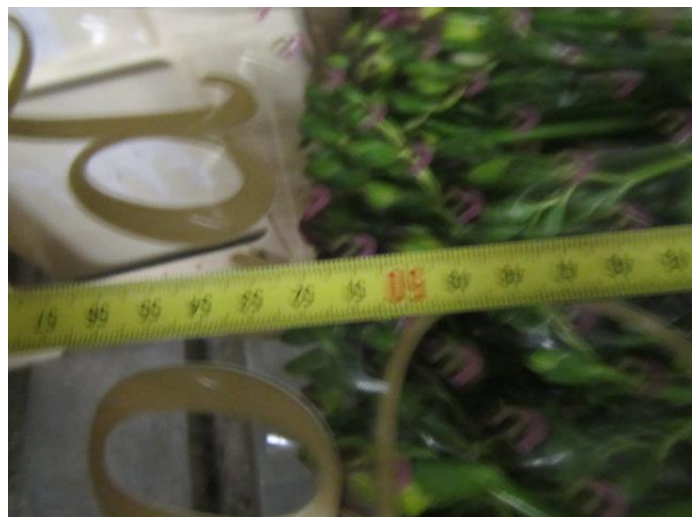
Onderkanten netjes gelijk