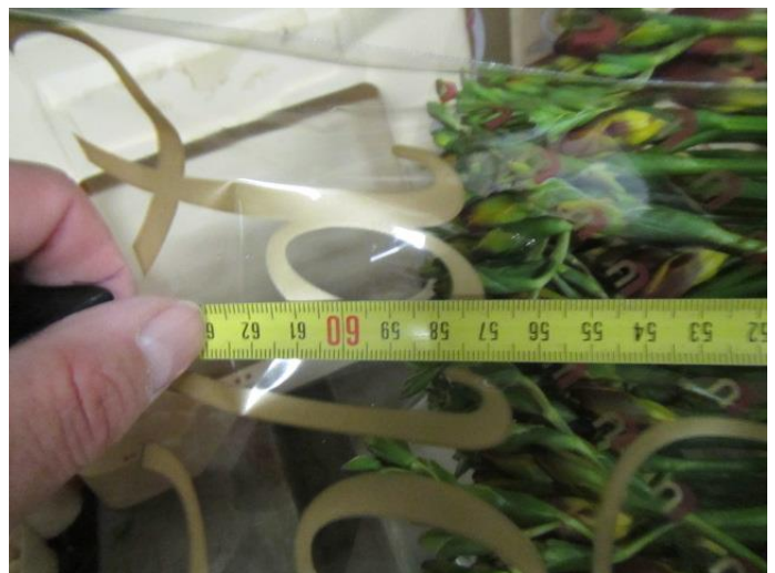
Onderkanten netjes gelijk