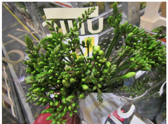
Onderkanten netjes gelijk