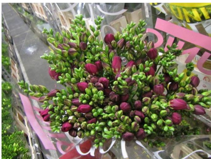
Aanvoer Purple Rain Aanvoer informatie