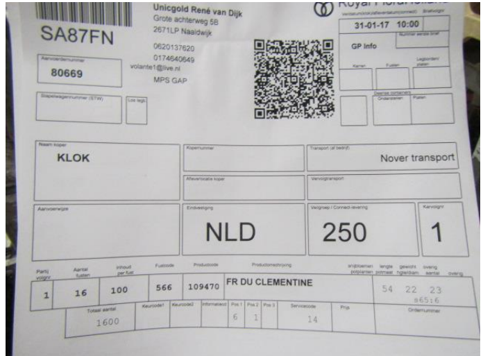
Aanvoer Clementine | Aanvoer informatie