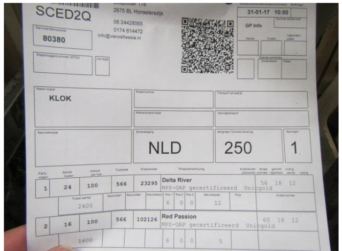
Aanvoer Red Passion