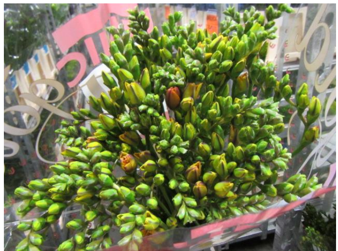
Onderkanten netjes gelijk | Overzicht rijpte 23 = 23