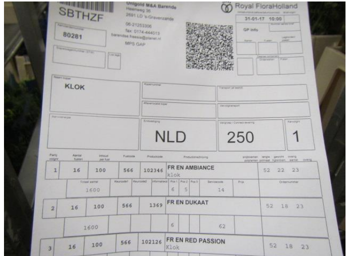
Aanvoer Red Passion