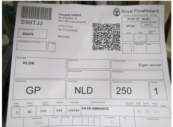
Aanvoer Ambiance | Aanvoer informatie