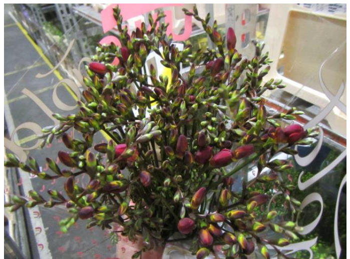
Onderkanten netjes gelijk