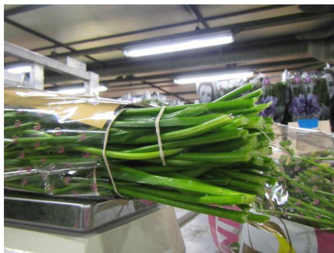
Overzicht rijpte 23 = 23 Onderkanten netjes gelijk