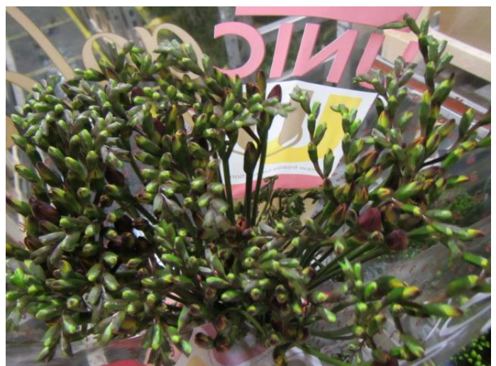
Onderkanten netjes gelijk