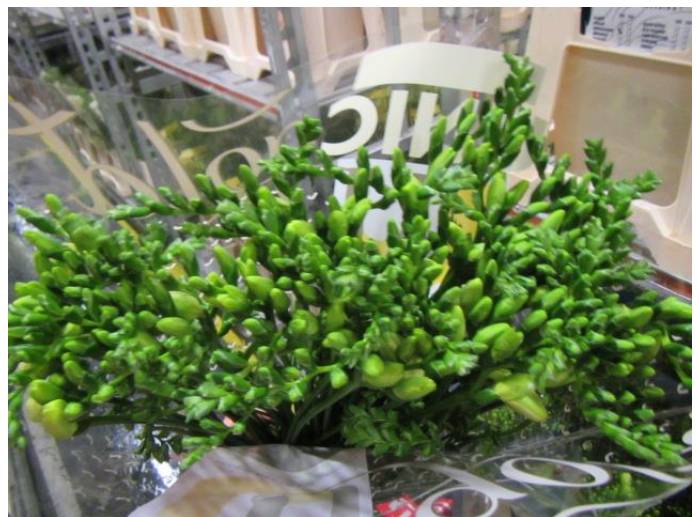
Onderkanten netjes gelijk | Overzicht rijpte 23 = net 23