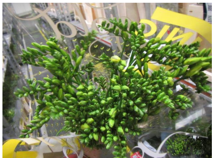
Onderkanten netjes gelijk