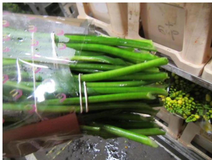
Overzicht rijpte 24 = 24