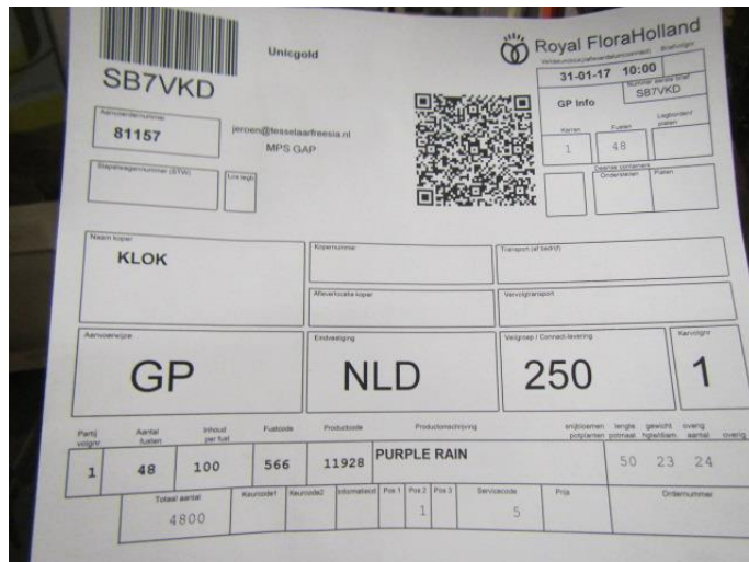
Aanvoer Purple Rain