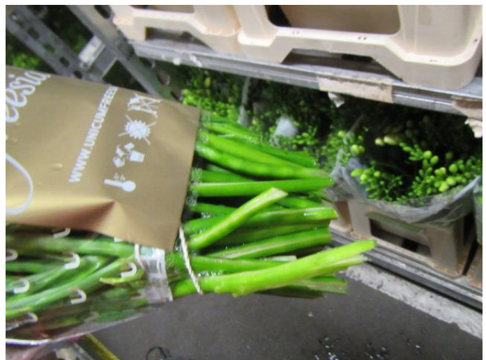
Overzicht rijpte 24 = 24