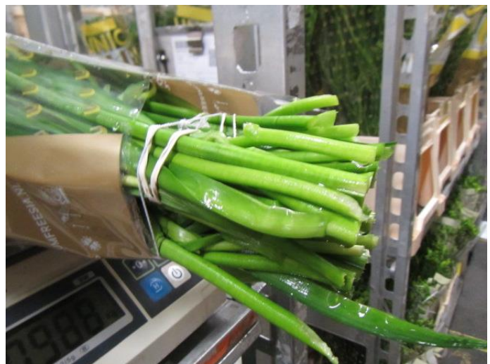
Overzicht rijpte 23 = net 23